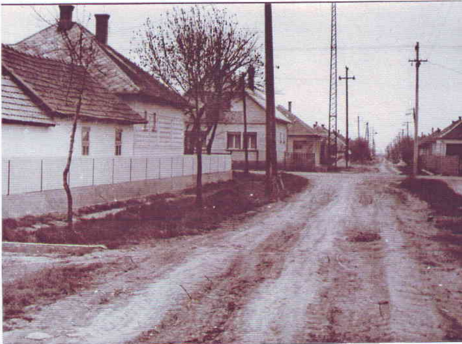
A Kossuth út még aszfaltozatlanul - szárazságban

Aztán meg, mivel nem voltak még aszfaltozott mellékutak, a traktornyomban, amelyek néha egészen emberes méretűre is nőttek egy – egy esősebb időszakban, eső után a fiúk egy fekete klottgatyában, a lányok azért kicsit jobban felöltözve járkáltak a bennük összegyűlt vízben.