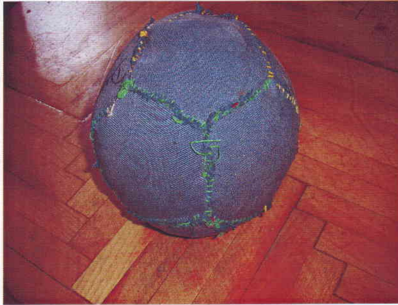
Rongylabda – készült a falukutató tábor lakói által, az Idősek Otthona lakóinak útmutatása alapján

A métázás is kedvelt játék volt, hiszen az árokparton, úton, erdőszélen megtalálható volt a lécs, a bot, amelyet kézbe fogva kellett a feléjük szálló rongylabdát minél messzebbre elütni, majd elszaladni egy előzetesen várnak kijelölt területre. Akit eltaláltak, vagy nem sikerült eljutnia a várig, amíg a dobó el nem kapta a labdát, akkor a következő körben ő lett a kidobó. Ezt már rongylabdákkal játszották, melyeket maguk készítettek. (ifj. Bene Józsefné)