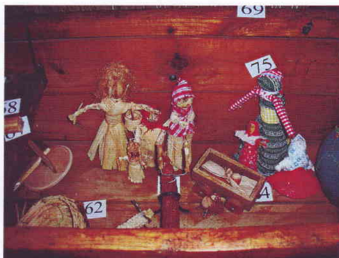
A falukutató tábor lakói által az Idősek Otthona lakói segítségével készített csutka – játékok

Ez az ökröfogat lehetett a mai lego őse, hiszen több apró darabból készítették és az esetek többségében csak maximum egy kést használtak a faragásukhoz, összeállításukhoz.