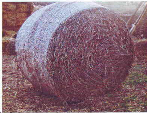
1. szénakazal 2. kisbálás kazal 3. körbála