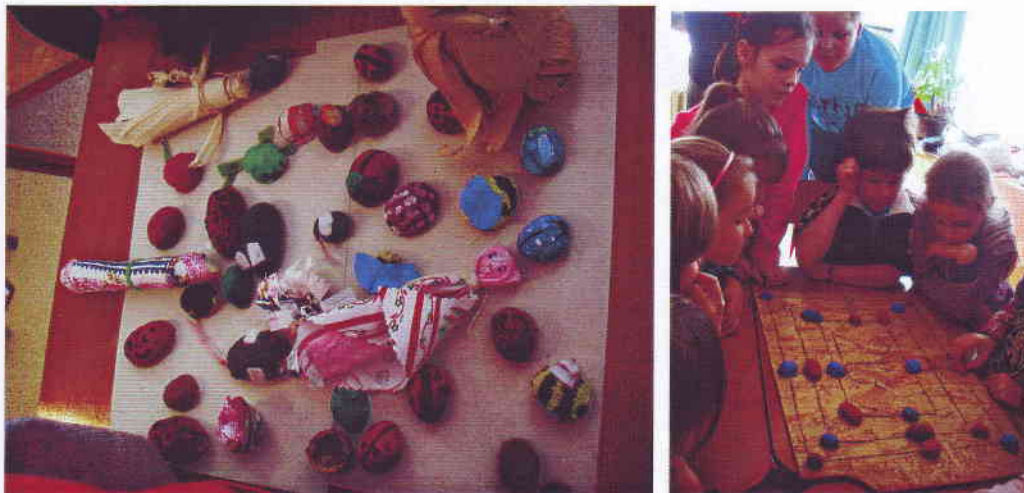
A kuckóban készült játékok másolatát készítették el a 2. b osztályosok az „Eleink élete” című program keretében

A téli hétvégék gyakran teltek családi, baráti, komasági összejövetelekkel, természetesen szigorúan csak a vasárnapi istentisztelet után. Minden hétvégén más családnál jöttek össze, ahol „kőttkaláccsal”, pirított tökmaggal készültek a háziak. Készítettek még pattogatott kukoricát is, a hegyes végű fajtából, amelyet sirminai kukoricának hívtak. Azt mondták róla, hogy akkor pattog ki igazán jól, ha a böjti szél már megfújta. Csemegének számított ezeken a napokon a fehér, nagy szemű kukorica, amelyet morzsolás után egy fazékban addig főztek, amíg ki nem nyílt és fővés után igény szerint sózták, vagy cukrozták. (Bene József) A felnőtt férfiak többnyire kártyáztak, a nők beszélgettek, csigát, kocka- csík, lebbencstésztát készítettek, hímeztek, a gyermekek pedig ez idő alatt a kemencepadkán, kemencelyukban – a kuckóban fából faragott lovakkal, faszekérrel játszottak, malmoztak, kockáztak .