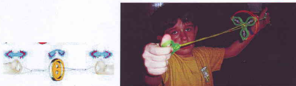
Balra egy gombos zungatyú, jobbra egy XXI. századi, már fényjelenséggel is bíró

Itt gyártották a zungatyúkat is, amihez elég volt egy darab vastagabb cérna, vagy madzag és egy kabátgomb – igen nagy kincs volt mindkettő akkoriban, úgyhogy nagyon meg kellett óvni - aminek mai megfelelője már műanyagból készült és a hang mellett megjelent a fényjelenség is. A kabátgombot előtte egy hengeres fadarabbal helyettesítették, amelyet középen két helyen kifúrtak.