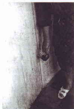
9. kép: Szenes víz készítése rontás gyógyítására – vízkimérés (balra), majd a vizet visszakézből az ajtó sarokvasára öntik 47

Besenyszögön megrontották a kisgyereket, megállíthatatlanul fogyott. Gyógymód az ilyen rontás okozta betegsége, ha harangszó között szenes vízben fürdetik, majd a fürdővizet háromszor öntik le a ház sarokvasán. Emellett minden nap rá kellett imádkozni, rájósolni, de ez utóbbiban már nem volt biztos az adatközlő. Sajnos arra sem emlékezett, hogy ki és miért rontotta meg a gyerekeket. 48