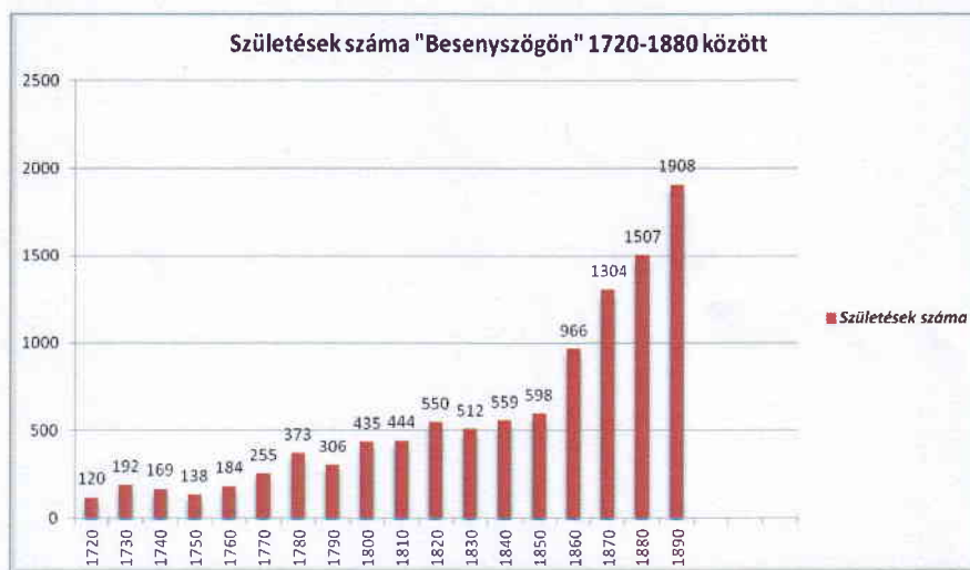
5. kép: A születések számának alakulása a mai Besenyszöghöz tartozó anyakönyvek alapján (függőleges koordináta a születések számát, míg a vízszintes koordináta az évtizedet jelöli, saját gyűjtés, saját szerkesztés)

Az új falut elsőként a kisnemes és őket kiszolgáló réteg lakta, akik az ország különböző részeiről telepedtek Szentivánba, vagy települtek vissza eltérő gazdasági és kulturális háttérrel. Bizonyos családok (például a Csomortányiak) Erdélyből érkeztek. Hozzájuk az 1700-as évek közepétől újabb társadalmi rétegek (szolgálók, telkes jobbágyok) csatlakoztak az ország észak-keleti részének több területéről különböző szokásokkal, hiedelmekkel, nyelvjárással. Jellemző az „ny” hang használatának elterjedése pl. Szentiván – Szentivány. A gyermekvállalások aránya is megváltozott. Míg az 1700-as évek elejét az alacsony születésszám jellemezte, a század végére már a magas gyermekszületés szám vált általánossá. 14