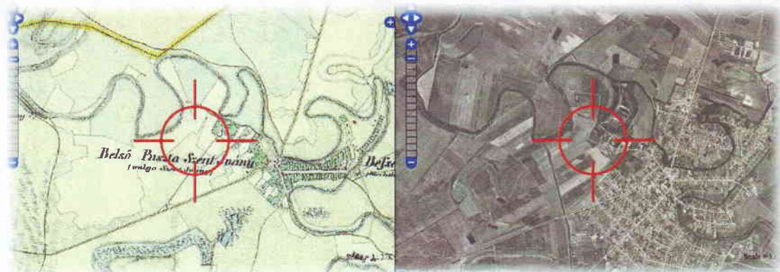
3. kép: Szentiván helye az 1860-as években a Magyarország II. katonai felmérésekor készült térképen (bal oldal) és ugyanez a hely napjainkban műholdképen (jobb oldal) 11