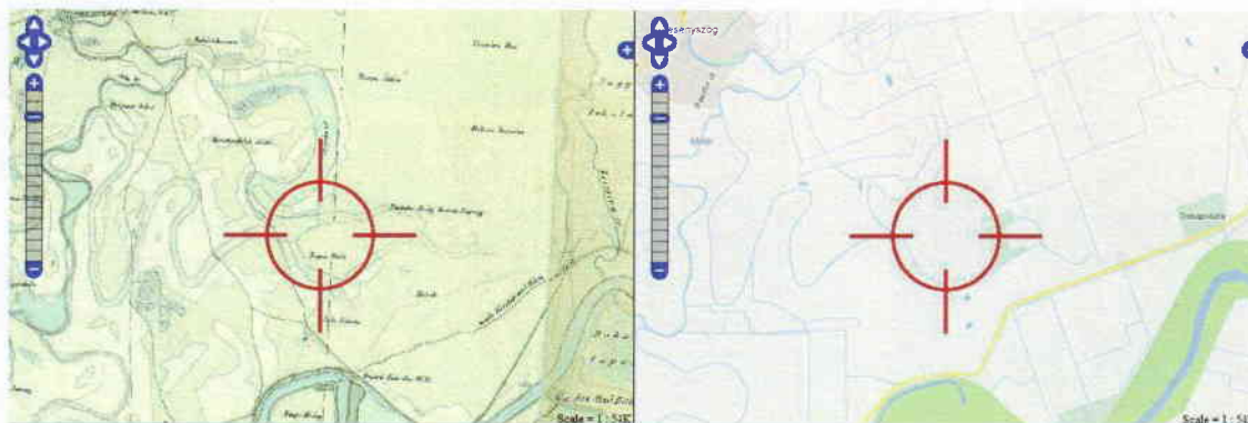
2. kép: az egykori Szeg falu helye: a karikával jelzett hely alatt a Tisza egyik szögében fekszik Nagyszeg, a kör felső bal sarkában pedig a mai Besenyszög, a jelzéstől jobbra Doba, de Szeg pusztája egészen a mai Besenyszögig elnyúlt a Millér partjáig 5

Álljunk a későbbi templom bejáratával szembe és nézzünk szét a környéken! 4 Balra indulunk, és végigsétálunk a mai Dózsa György úton. Átkelünk a Milléren. Egy rövid séta után már a szegi határban járunk, a Kenderföld-dűlő mellett elhaladva Doba alatt találjuk a régi Szeg falut, amelyet már a 14. század végén említenek az egykori iratok. Útközben látjuk az egykori templomot, amelynek felújítását, felszerelésének pótlását 1670-ben az egri püspöktől kérték a helyi lakosok, mivel azt a tolvajok kifosztották. A falu a Tisza közelében feküdt a mai Nagyszegig elnyúlva, amely ma a holtág és Szórópuszta mellett található. A 19. században itt egy ismert csárda állt: a Szóró-csárda. Szeg falu – az alföld sok más településéhez hasonlóan – a török kiűzését kísérő harcok, fosztogatások következtében lakatlanná vált, 1687-ben már, mint elpusztult helyet, pusztát tartották számon, akinek lakói Jászladányba menekültek. Doba a 13. században már említett település volt a Tisza mellett, ma is ismert pusztája és kedvelt fürdőhelye.